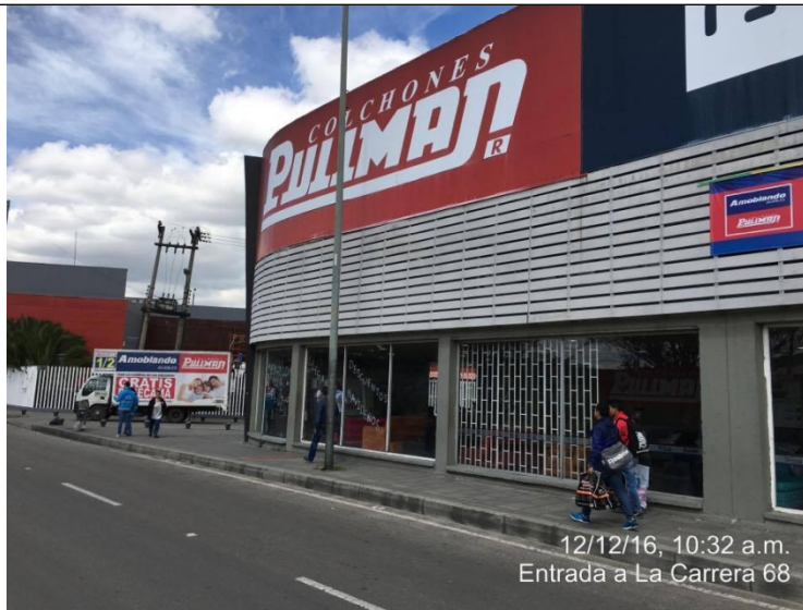
Fotografía No. 2 Elemento de publicidad tipo Aviso en Fachada, instalado en fachada del establecimiento de comercio ubicado en la Avenida Américas No. 67 – 44, el cual no cuenta con registro.