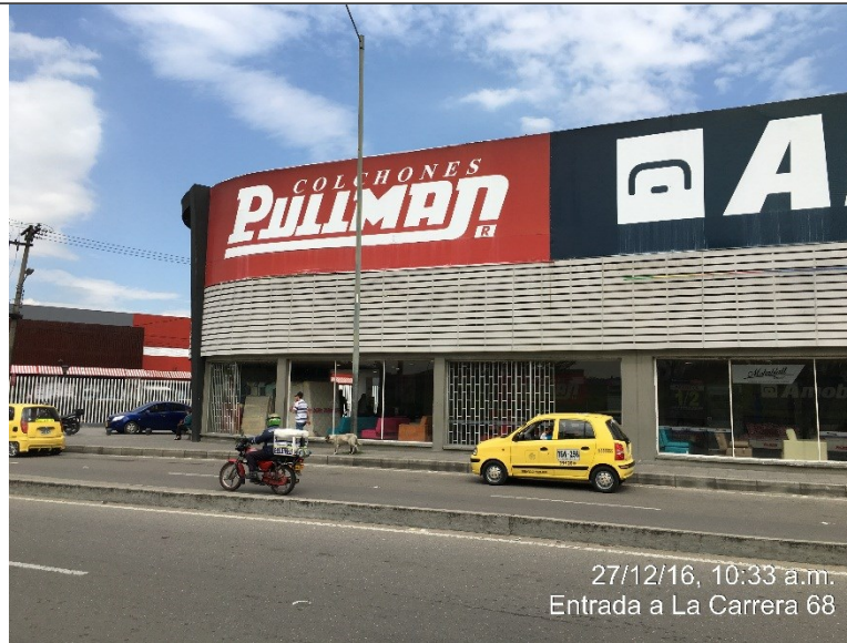
Fotografía No. 1 Elemento de publicidad tipo Aviso en Fachada, instalado en fachada del establecimiento de comercio ubicado en la Avenida Américas No. 67 - 44, el cual no cuenta con registro

27/12/16, 10:33 a.m. Entrada a La Carrera 68