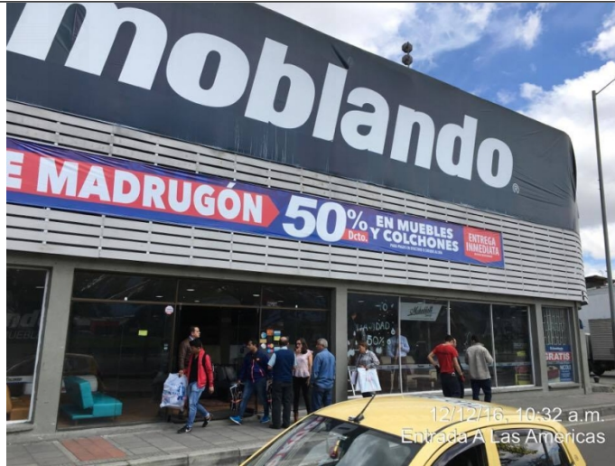
Fotografía No. 1 Elemento de publicidad tipo Aviso en Fachada, instalado en fachada del establecimiento de comercio ubicado en la Avenida Américas No. 67 – 44, el cual no cuenta con registro

REGISTRO FOTOGRAFICO, visita efectuada el día 12/12/2016.