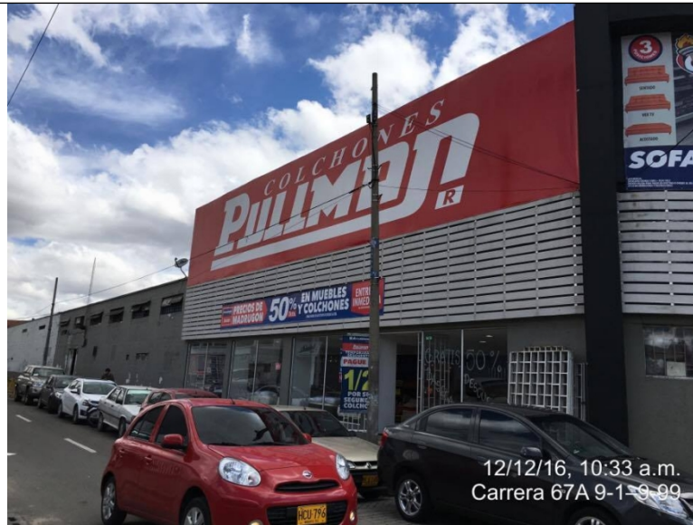
Fotografía No. 4 Elemento de publicidad tipo Aviso en Fachada, instalado en fachada del establecimiento de comercio ubicado en la Avenida Américas No. 67 - 44, el cual no cuenta con registro

REGISTRO FOTOGRAFICO, Visita efectuada el 27/12/2016